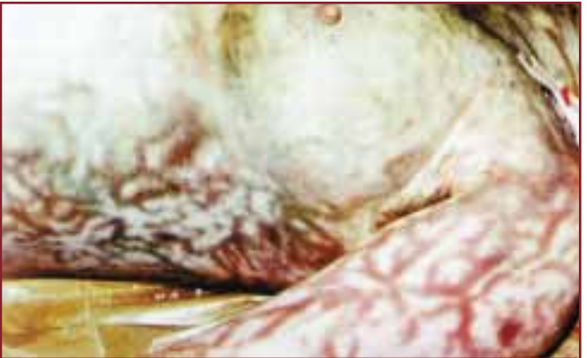
CESEDİN PARÇALANMAYA BAŞLAMADAN ÖNCEKİ DURUMU