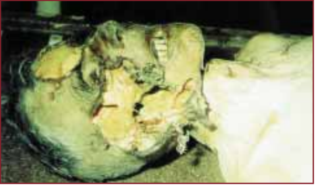
MEZARDA BÖCEKLER TARAFINDAN YENMİŞ BİR İNSAN YÜZÜ