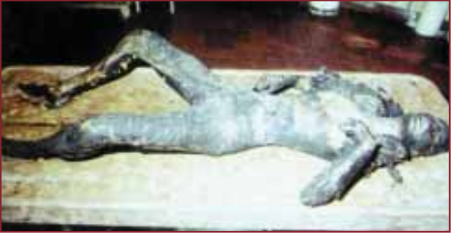
YANARAK ÖLMÜŞ BİR İNSAN CESEDİ