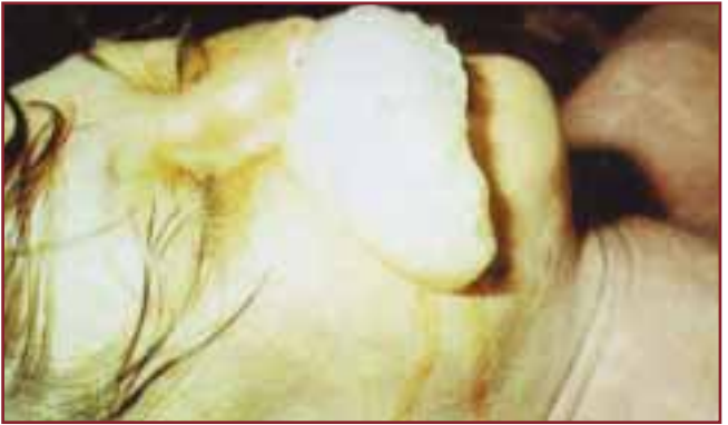
AĞZINDAN KÖPÜKLER GELEK ÖLMÜŞ BİR İNSAN